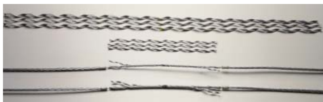
Соединительные зажимы PLP, не содержащие магнитных материалов