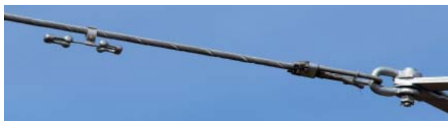
Клиновой зажим Vari-Grip™